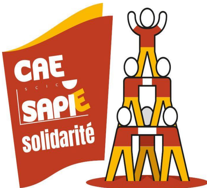
Figure 1 : la CAE, des valeurs partagées par les formateurs de Sapie