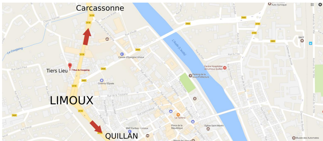
Figure 3 : plan d'accès à Sapie

Accès en bus et en train depuis Carcassonne.