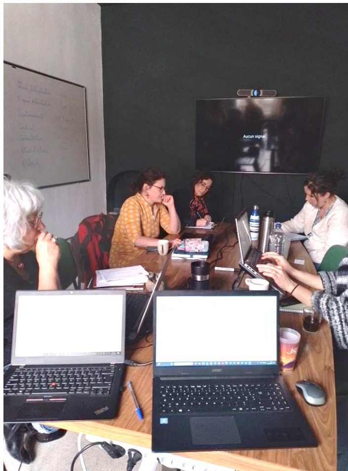
Figure 2 : une des deux salles de formation équipées pour le multimédia